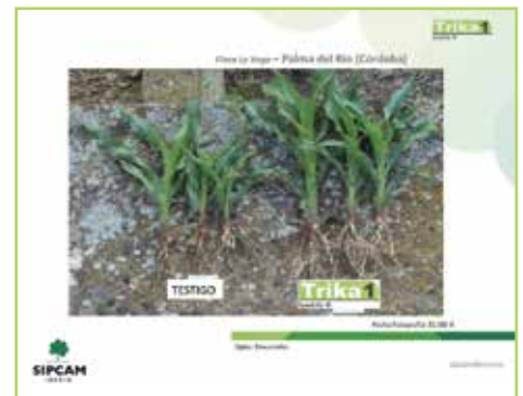
Vemos la enorme diferencia de la planta usando TRIKA y con el testigo.