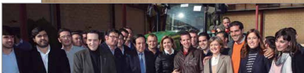
Los jóvenes agricultores de la Asociación en el Congreso Nacional de ASAJA.