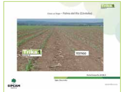
Comparación nascencia maíz con TRIKA y con testigo. La diferencia es clara.