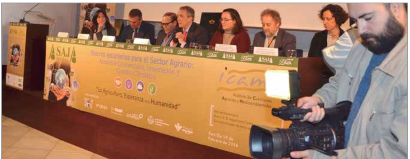
Mesa redonda: “Nuevos escenarios para el sector agrario”.