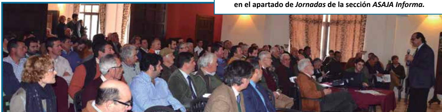
Asistentes a la XXXI Jornada Ganadera y de la Dehesa organizada por ASAJA-Sevilla en Cazalla de la Sierra.

Si estás interesado en consultar las ponencias, puedes descargarlas en nuestra página web, www.asajasevilla.es , en el apartado de Jornadas de la sección ASAJA Informa.