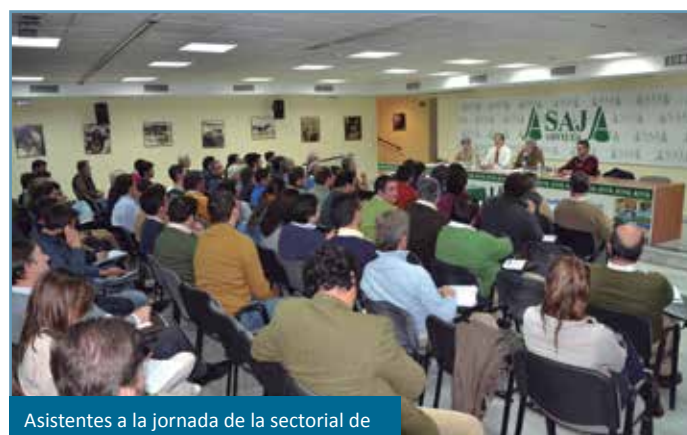
Asistentes a la jornada de la sectorial de Jóvenes de ASAJA-Sevilla.