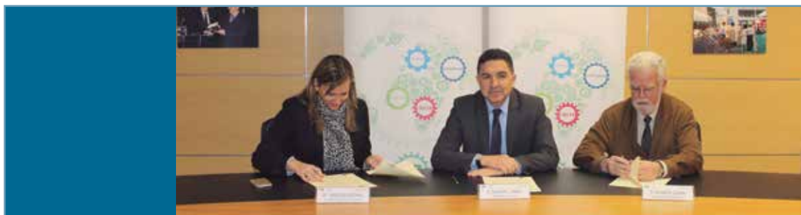
Firma del convenio de colaboración entre Extenda e Interaceituna el pasado 23 de febrero.