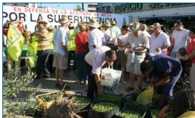
Reparto de aceituna de mesa en Sevilla, organizado por ASAJA en 2011 para protestar por los bajos precios.

de mesa y el 25% de toda la aceituna que se consume en el mundo. Es una de las actividades agrarias que demanda más empleo, las 20.000 explotaciones que se dedican a este cultivo generan 8 millones de jornales al año , mientras que las más de 400 empresas que se ocupan de su transformación y envasado emplean a 8.500 personas .